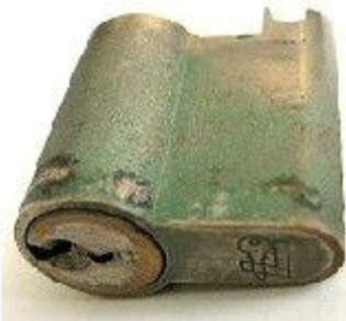
Cylindre européen fracturé

Équipez vos portes de cylindres anti-perçage, de cornières anti-pince et d'une barre de seuil