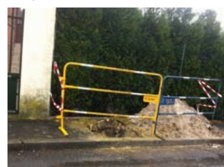
700 branchements d'eau tuyauteries plomb sont en cours de changement