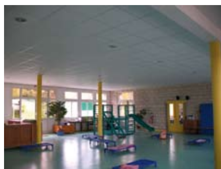
Ecole Paul Langevin (novembre 2010) Faux plafond de la salle polyvalente terminé