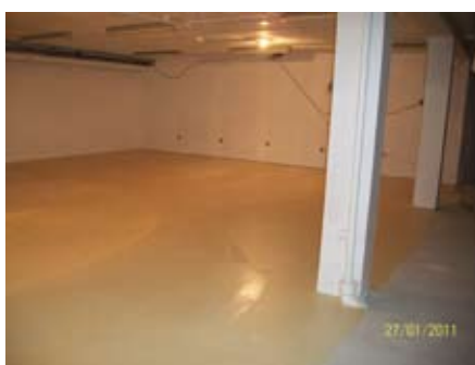
Restos du Cœur (février 2011) Aménagement des locaux