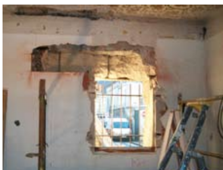
Centre Communal d'Action Sociale - Aménagement des locaux rue Frtras (février 2011)