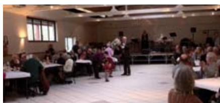
Thé dansant - Le 14 décembre 2010