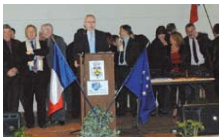
Cérémonie des Vœux Le 22 janvier 2011