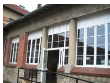
Salle de danse Jules Ferry (janvier 2011) Changement des menuiseries