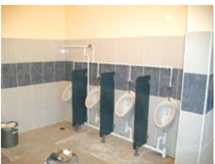
Ecole Jules Ferry (février 2011) 1er côté des nouveaux sanitaires