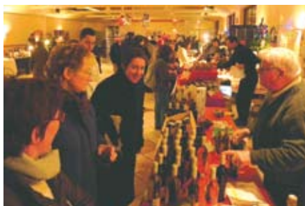
Marché de Noël Le 04 décembre 2010