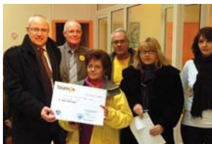
Téléthon - Le 05 décembre 2010