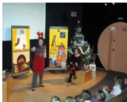
Fêtons Noël Le 15 décembre 2010